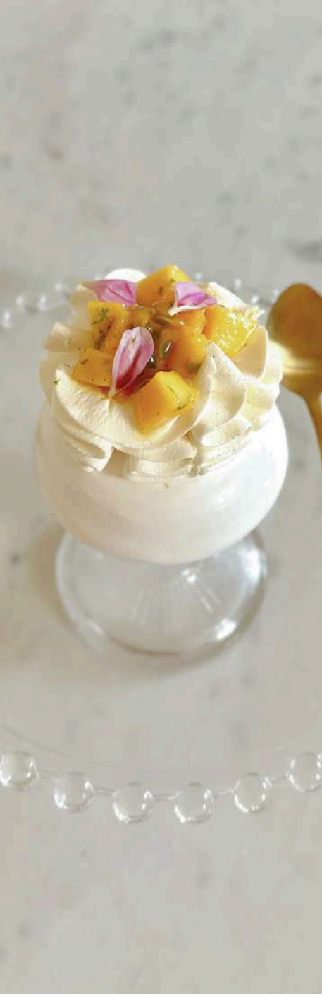
PAVLOVA AUX FRUITS EXOTIQUES