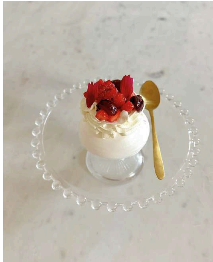
PAVLOVA AUX FRUITS ROUGES

Une recherche néo-zélando-australienne ultérieure met en avant des origines américaine et allemande.